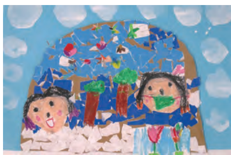
能美市長賞 白山で遊んでいるよ 高井 ひなみ (能美市)