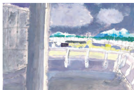
加賀市長賞 夜のくもり空 西村 こはる (小松市)