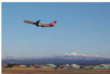
野々市市長賞 カーゴルクスに夢を乗せて 竹田 広太郎 (野々市市)